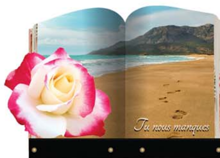
Plaque n° 2