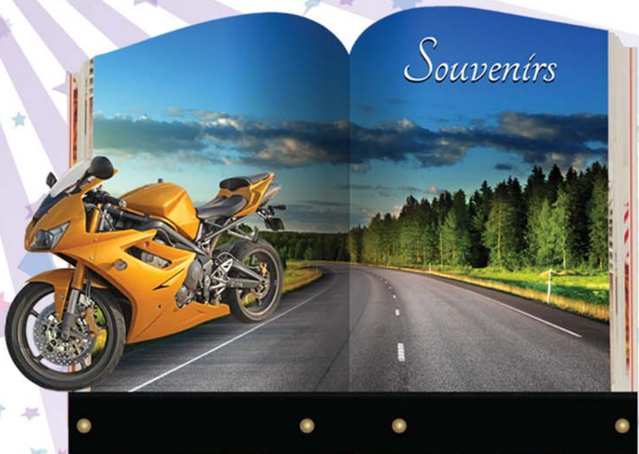
Plaque n° 3