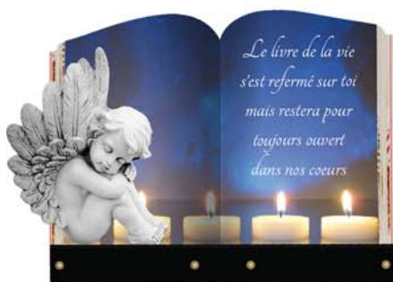
Plaque n° 1