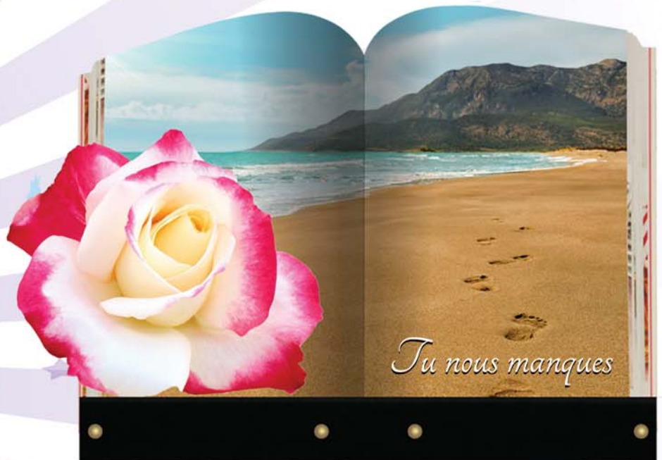
Plaque n° 2