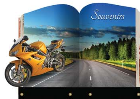
Plaque n° 3